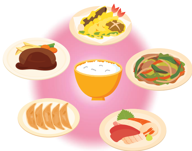
図 10-1 「ごはん」はいろいろな料理で仲良くできます

主食のごはんに代えて、めん、パンを食べても大丈夫です。ただし、あんぱんやクリームパン、デニッシュなど砂糖や油の多いパンは、毎食は食べないようにしましょう。油や、砂糖を主食から摂ると、エネルギー量を多く摂りすぎてしまう可能性が多いからです。