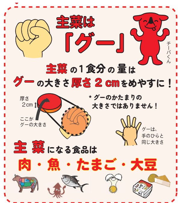
図11-1 主菜の種類と量