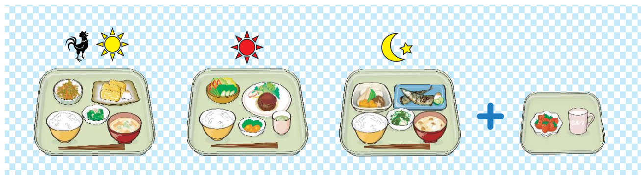
図9-4 「ちば型食生活」食事実践スタイル（ゲー・パー食生活）(2200kcal程度)