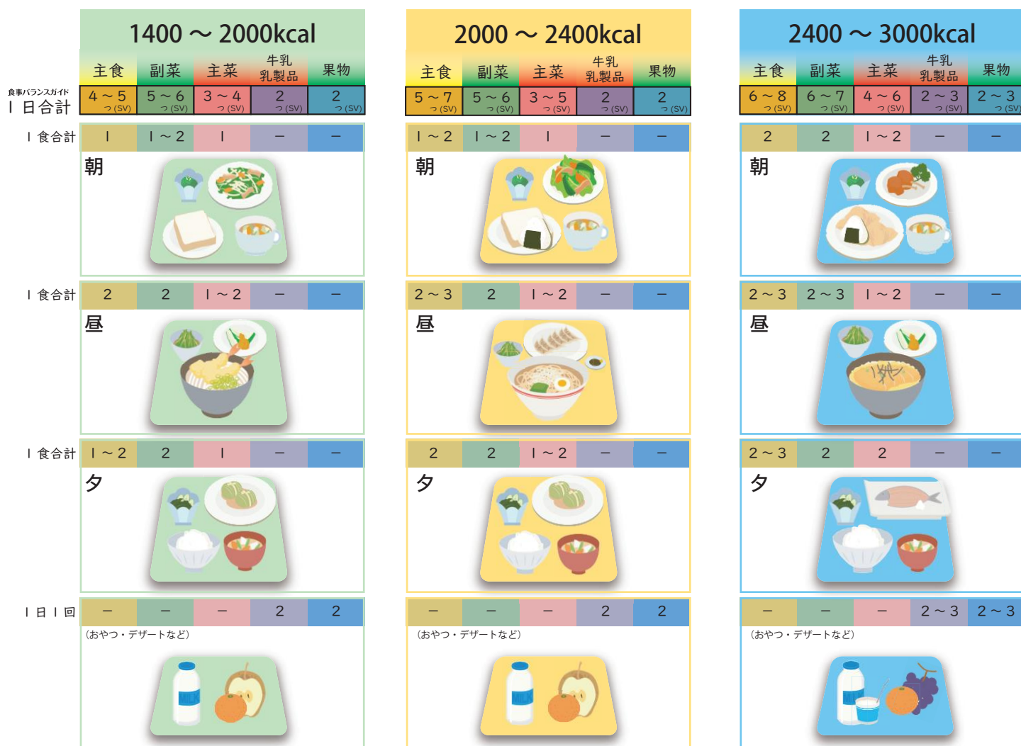
図 9-5 食事バランスガイドの 1700kcal、2200kcal、2700kcal に対応する「ゲー・パー食生活」