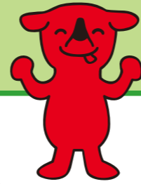
千葉県 マスコットキャラクター チーバくん