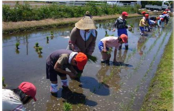
【食育活動支援事業】