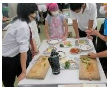
【ピザトースト作り】