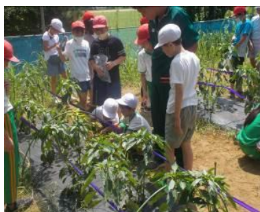
【ピーマンの苗植え】

豊かな圃場や施設をもつ本県の農業・水産系高等学校を支援校として、県内の高等学校ごとに幼稚園、小学校、中学校、義務教育学校から参加校を選定し、支援校と各参加校との協議のもと、支援校である高等学校の圃場や施設の利用及び職員の支援を受け、児童生徒等の発達段階に応じた、千葉県ならではの体験を取り入れた食育活動を展開し、その成果を県下に周知し、県全体の食育活動の一層の推進を図ることを目指す支援事業を行っている。