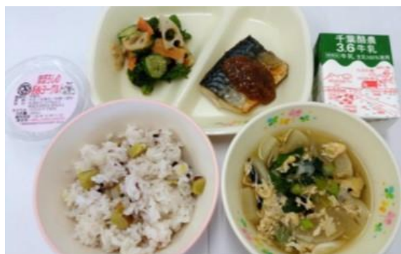
【ホームページに掲載している内容】