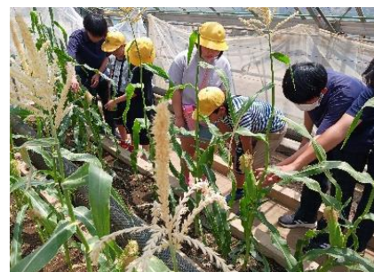
【とうもろこしの収穫】