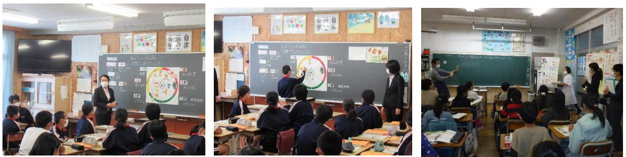
【令和5年度 食育指導進拠点校の授業の様子】

県内5教育事務所管内計16名の栄養教諭に食育指導推進委員を委嘱し、その所属校を食育指導推進拠点校として、年度内に約半数の食育指導推進委員が1回以上の公開授業を行うこととする。また、食育指導推進全体連絡協議会を年3回開催し、それぞれの実践状況や課題等の協議を行い、指導力の向上を図る。