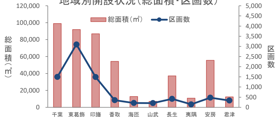
地域別開設状況(総面積・区画数)