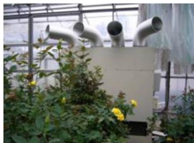
ヒートポンプの導入