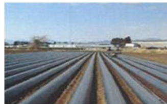
生分解性マルチの利用