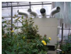
ヒートポンプの導入