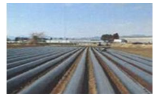
生分解性マルチの利用