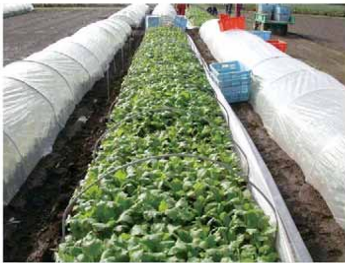
▲ 害虫の加害を防ぐ為の刈藪雑不織布(割布)被覆

春どり栽培は、収穫期に向けて気温が上昇し、害虫が活動し始める時期に当たります。ハモグリバエ類、コナガの防除が中心になります。播種時にフォース粒剤を処理し、生育期間中は発生害虫に応じて薬剤を選択します。白さび病が発生しやすいため、抵抗性品種の利用やジーファイン水和剤を予防散布します。ただし、常発圃場では播種時にリドミル粒剤2を処理します。